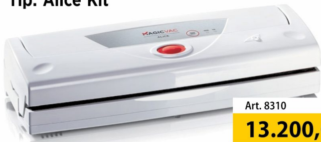
Vakum aparat Magic Vac Tip: Alice Kit