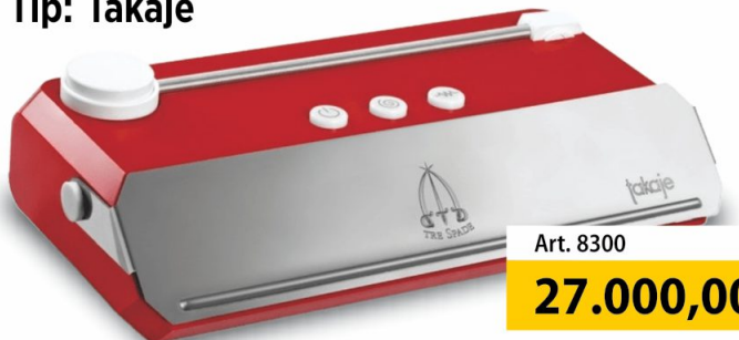
Vakum aparat Tre Spade Tip: Takaje